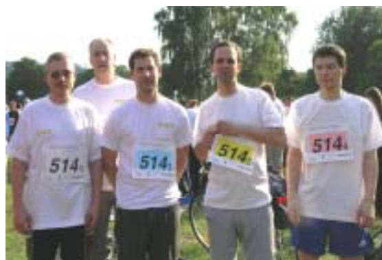
Das Team von KMS

KMS.de SoftwareEntwicklung GmbH Ebersstraße 39 Tel: 030/7828381 10827 Berlin Fax: 030/7820340 Web: www.kms.de E-Mail: info@kms.de