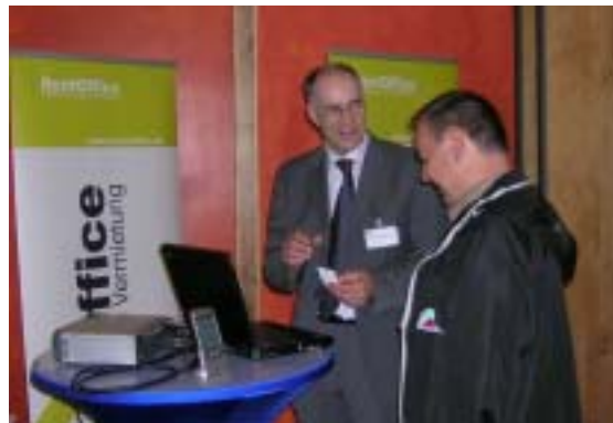
Herr Schönefeld im Gespräch